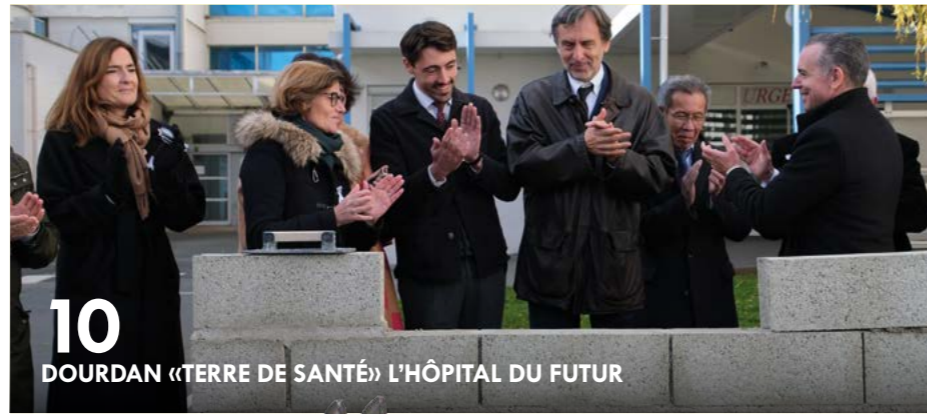
10 DOURDAN «TERRE DE SANTÉ» L'HÔPITAL DU FUTUR