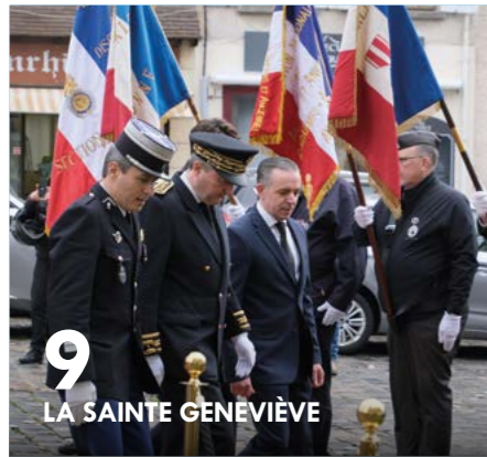
9 LA SAINTE GENEVIÈVE