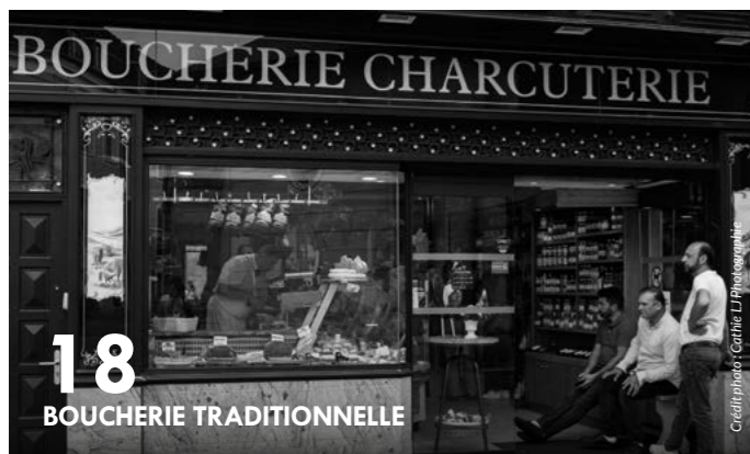
18 BOUCHERIE TRADITIONNELLE