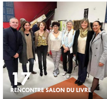
17 RENCONTRE SALON DU LIVRE