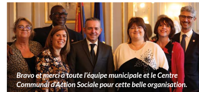
Bravo et merci à toute l'équipe municipale et le Centre Communal d'Action Sociale pour cette belle organisation.