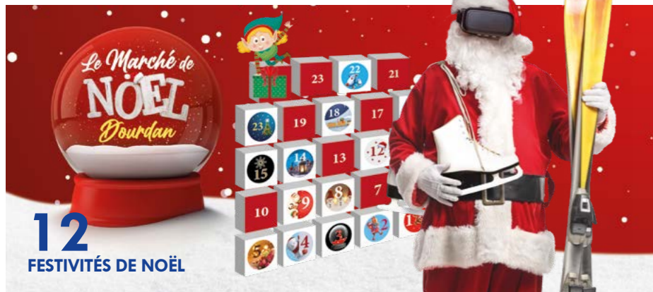
12 FESTIVITÉS DE NOËL