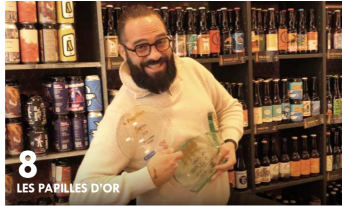
8 LES PAPILLES D'OR