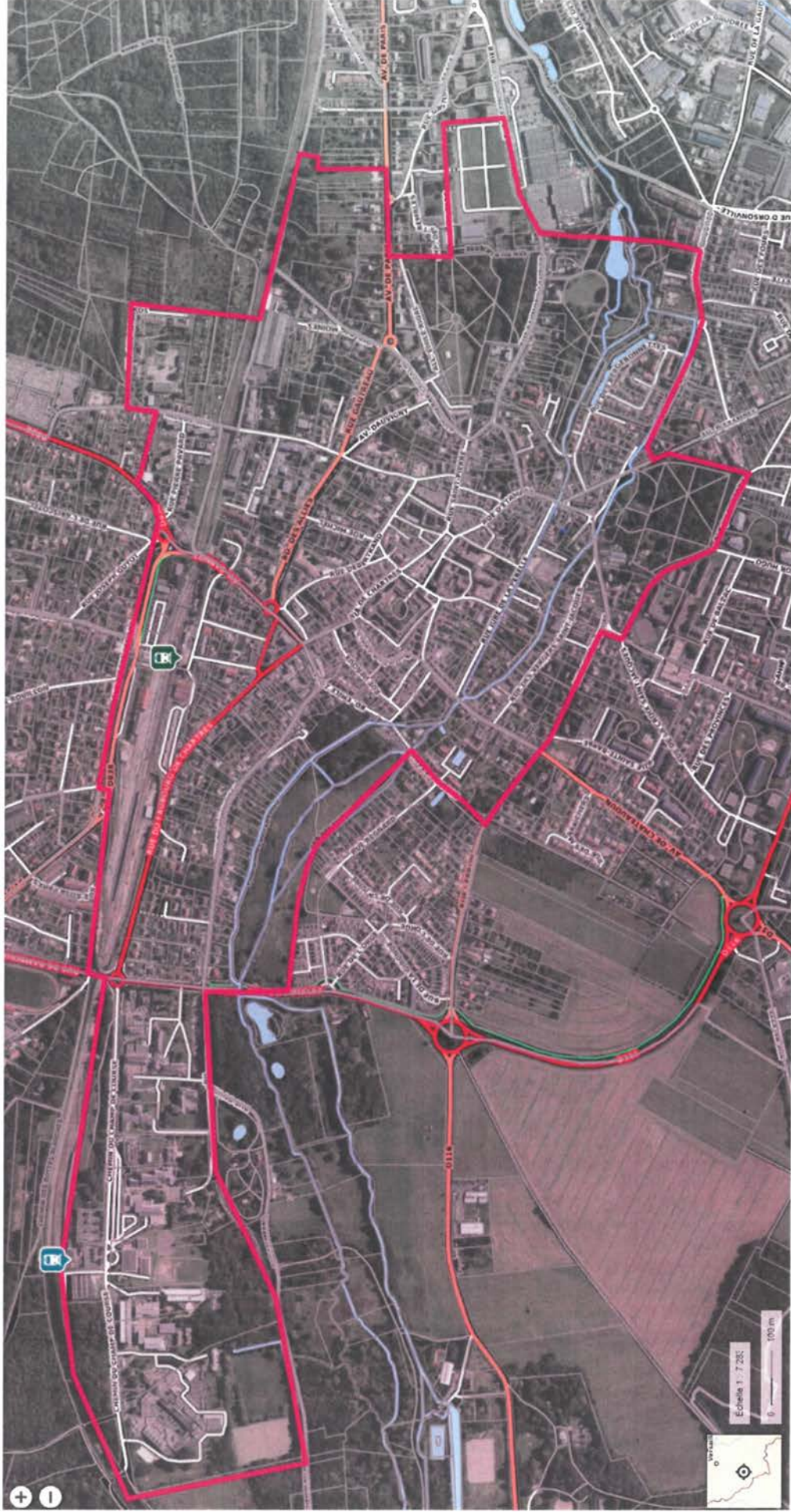
Annexe 3 – Fiches actions et cartographie